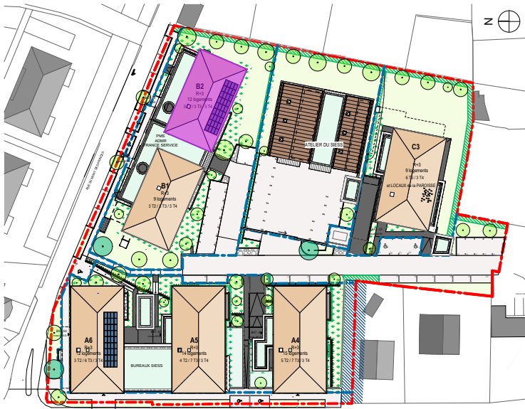
LOCALISATION DANS LE PROGRAMME